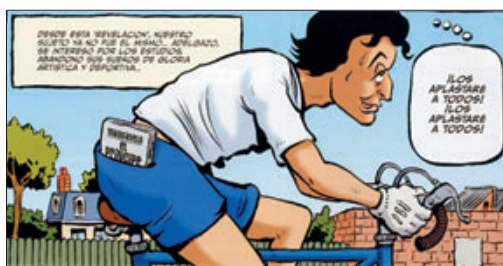
► Viñeta de Ferreres y dibujo del álbum La cara oculta de Sarkozy .

La cara oculta de Sarkozy es una minuciosa, ácida y desternillante biografía del candidato de la derecha a la presidencia. El álbum ha vendido 160.000 ejemplares en Francia. «Es una innovación cuyo éxito ha sorprendido en primer lugar a