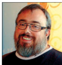
ÁLEX DE LA IGLESIA DIRECTOR DE CINE

«Spiegelman demuestra en Maus que se puede escribir dibujando. En el Saló, presento Montecristo. 1941 »