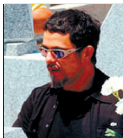
► Alejandro Sanz.