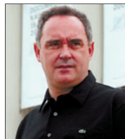
► Ferran Adrià.