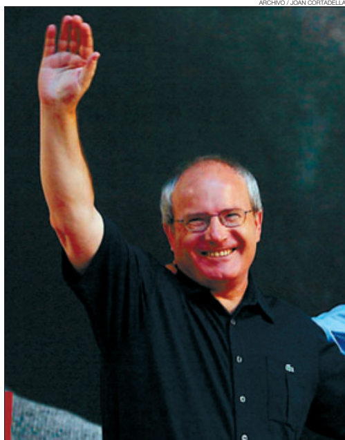
EN PLENO MITIN ► El presidente de la Generalitat, José Montilla, saluda sonriente al público en un acto en Gavà, en septiembre del 2006.

► El Pasapalabra de las Juventudes Socialistas.