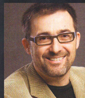
Antoni Gutiérrez-Rubí consultor político

Articulista y experto en estrategias de comunicación pública y social, analiza en "Políticas" (El Cobre, 2008) las características del liderazgo femenino y las posibilidades que se le ofrecen en una nueva sociedad dominada por la política de las emociones.