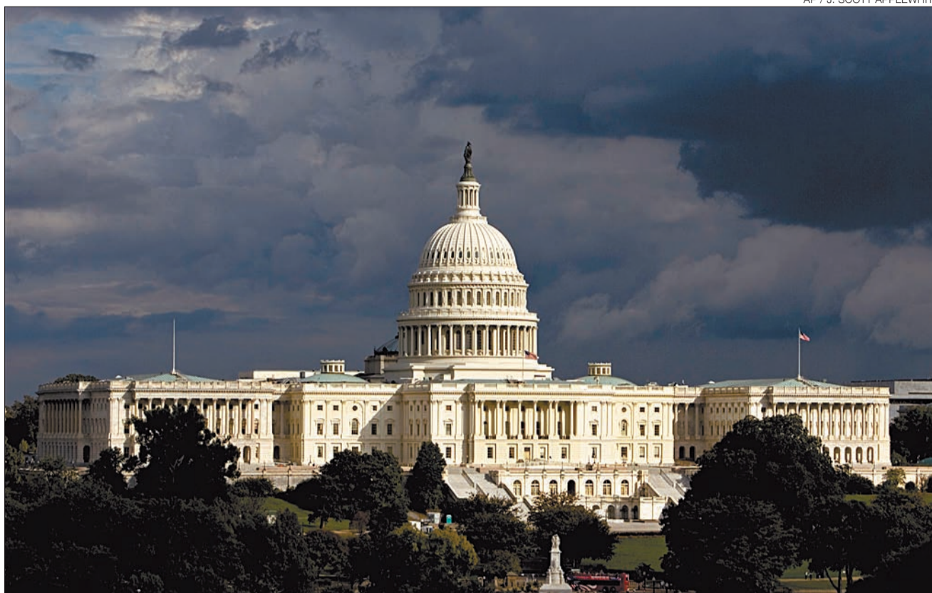
► El Capitolio, en Washington, símbolo de la democracia estadounidense.

George Washington, John Adams y Thomas Jefferson fueron los fundadores de la república norteamericana y, por este orden, los primeros presidentes. A ellos dedica Gore Vidal su ensayo La invención de una nación (Anagrama), en el que explica cómo elaboraron una Constitución que debía crear una democracia auténtica. Vidal, perteneciente a una familia de larga tra-