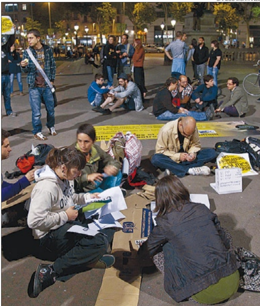
►► Sentada en la plaza de Catalunya, anoche.

tienen o han tenido un contrato precario pese a tener varios títulos y hablar idiomas; se informan a través de la red, y desconfían de los sindicatos (hubo una larga pitada frente a la sede de CCOO) y los bancos, de los medios y de la gestión de la política actual, pero no de la política.