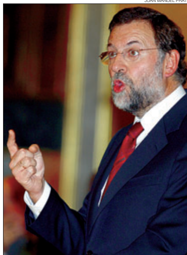
▶▶ Rajoy, pronunciándose contra el texto catalán.