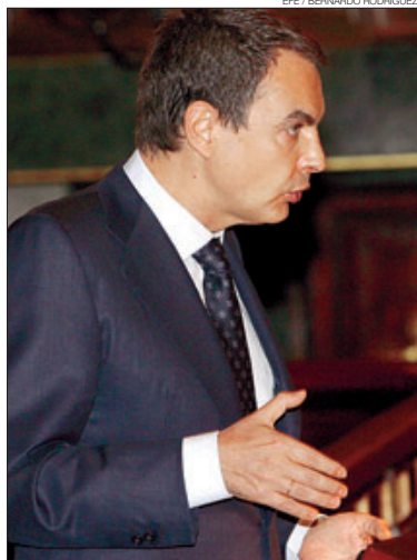
▶▶ Zapatero, aceptando discutir el Estatut.

Los dos modelos de liderazgo político en liza en España también se polarizan –con mayor o menor estrategia y conciencia– entre dos grandes marcos conceptuales: el del vigilante y el del árbitro. Rajoy , como Holden, el protagonista de la novela de J.D. Salinger , El guardián