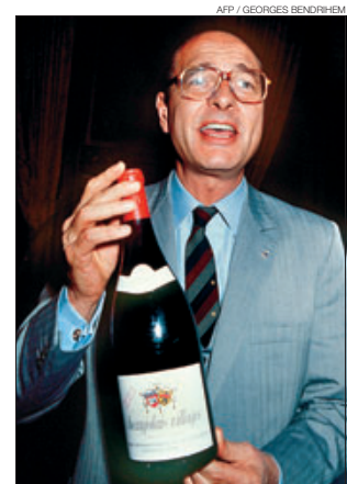
AFP / GEORGES BENDIRHEM ►► Quan era alcalde de París, el 1983.