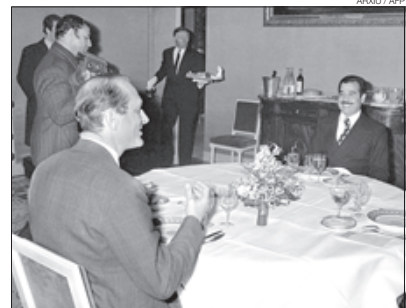
El llavors primer ministre, amb Saddam (1975).

Agricultura li vénen les seves privilegiades relacions amb els agricultors i ramaders, que cuida cada any amb les seves visites al Saló de l'Agricultura, on acaricia el llom de les vaques, saluda els ramaders, beu cervesa -li agrada la Corona mexicana- i tasta els productes.