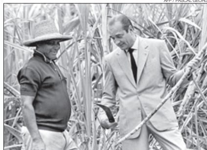
Tallant la canya a la Martinica (1988).