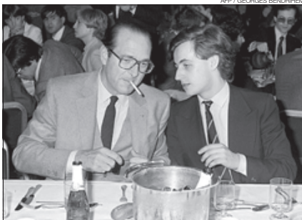
Al costat d'un jove Sarkozy, el març del 1981.