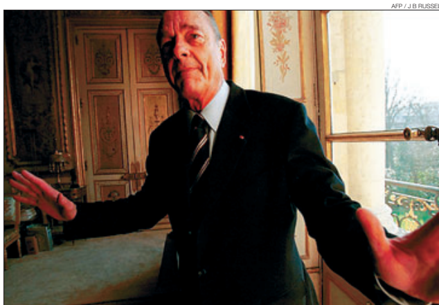
AFP / J B RUSSELL ►► Al Palau de l'Elisi, el febrer del 2003