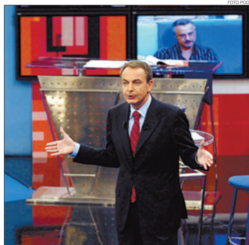
▶ El president del Govern, en un instant del programa de TVE.

El president del PSOE, Manuel Chaves, va destacar «la solvència i la credibilitat» de Rodríguez Zapatero,