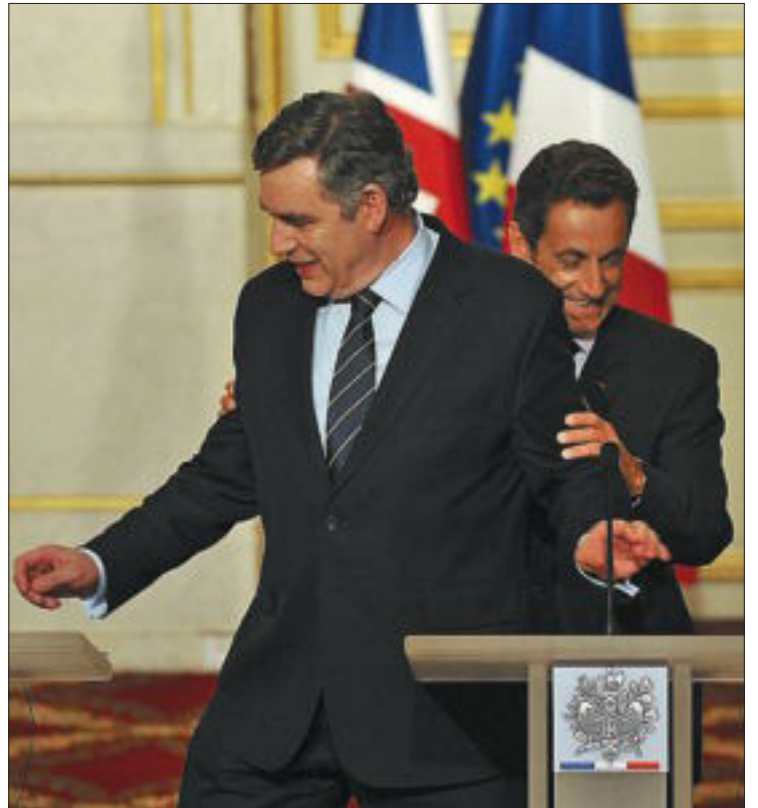
Gordon Brown y Nicolas Sarkozy, en un encuentro el pasado martes.

Las sanciones se aplicarán "a nivel nacional", según el borrador de la propuesta, al que ha podido acceder este diario. Paí-