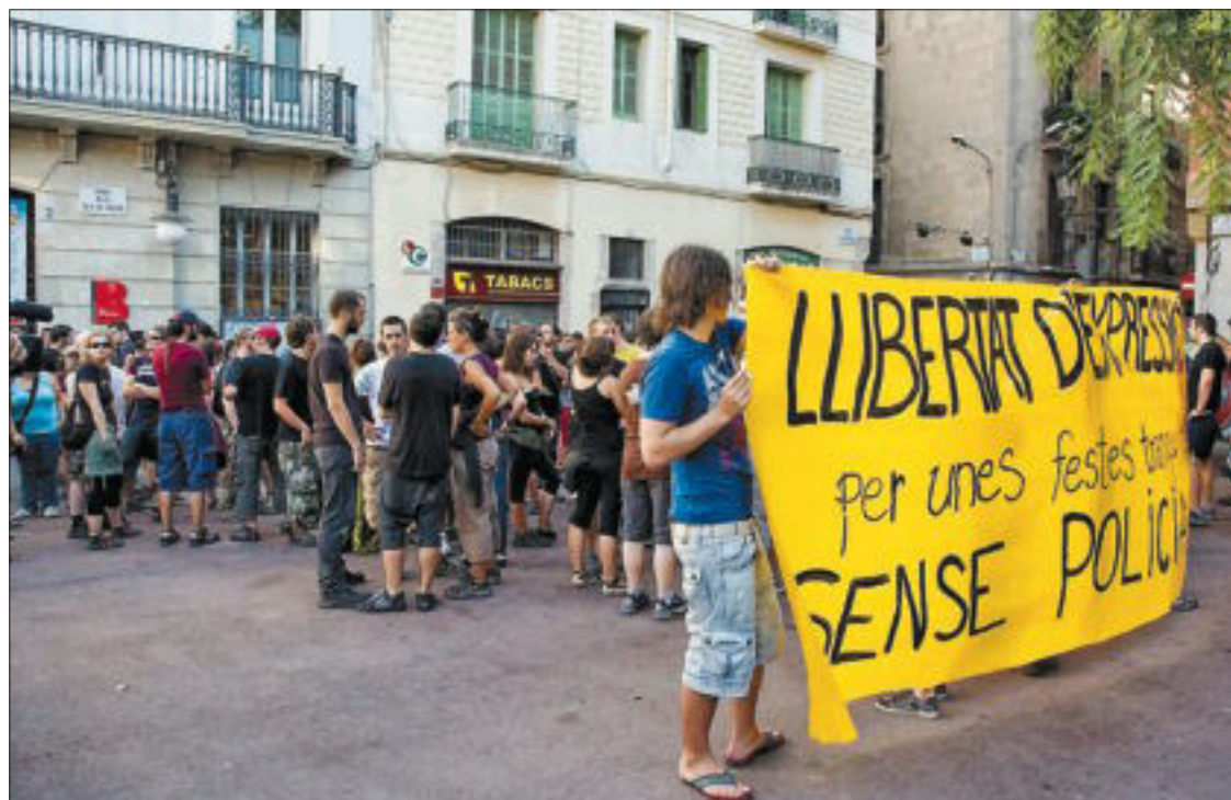
Los jóvenes desplegaron una pancarta pidiendo libertad de expresión.

El barrio de Gràcia amaneció ayer repleto de carteles reclamando la puesta en libertad de Martí y tres de sus compañeros, que según el colectivo habían sido "secuestrados". Por este moti-