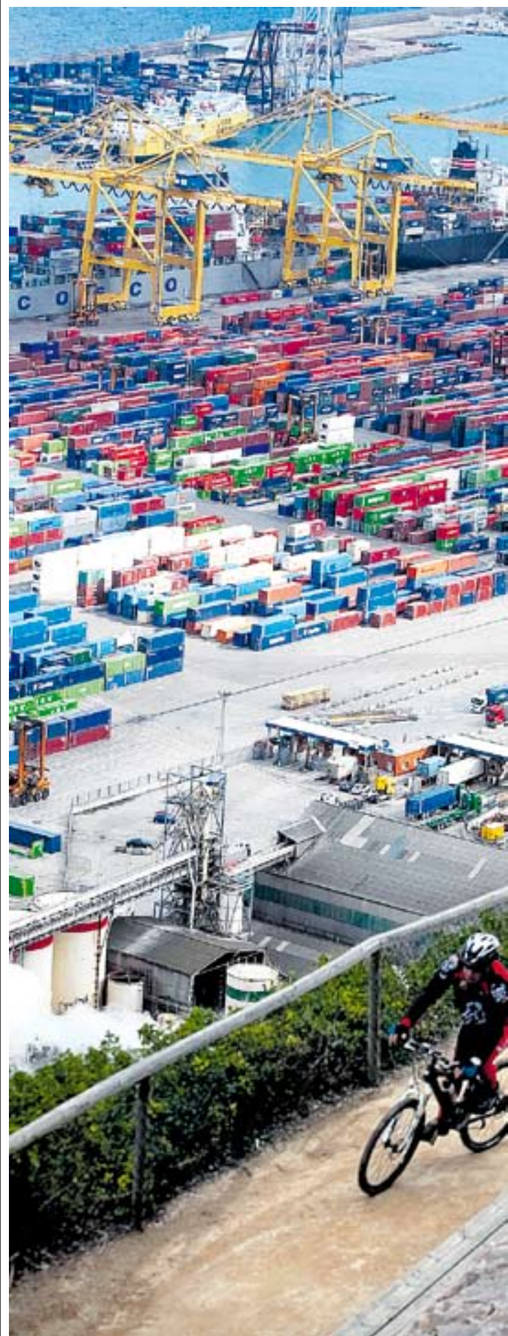
Les exportacions són clau per mantenir els llocs de treball de

Segons l'estudi, l'evolució de la demanda i la nova normativa fiscal són les responsables de la limitació de les de-