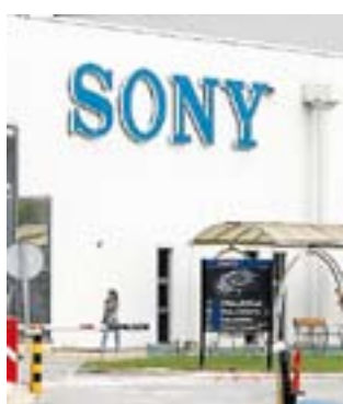
Planta de Viladecavalls.

Catalunya era seu de les multinacionals de l'electrònica de consum. Panasonic, Phillips, Braun, Miniwatt i Samsung es van acabar deslocalitzant per instal·lar-se a l'Europa de l'Est o a la Xina. L'últim cas és el de Sony. La japonesa va decidir deixar de fabricar televisors i una de les fàbriques afectades és la de Viladecavalls, on treballen més de 1.000 persones. En aquesta legislatura, la Generalitat ha posat molt èm-