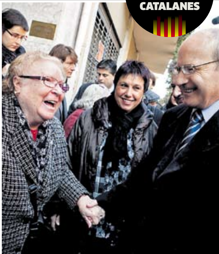
Montilla fa broma ahir amb una veïna al Bon Pastor.

Res ni ningú pot aturar el martell inexorable del progressisme. Ni Can Ricart, ni la Colònia Castells. Les cases barates que eren un