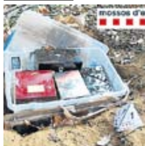
Part del material robat.