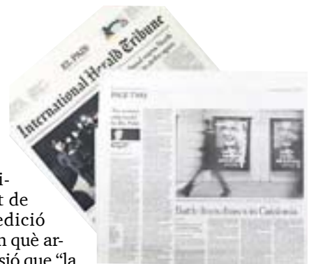
L'article publicat al 'NYT'.

talana està sent motiu d'informació als mitjans de comunicació estrangers. A part de les tensions de l'Estat de les autonomies i els canvis que en la societat catalana ha comportat la sentència del Tribunal Constitucional sobre el recurs que el PP va presentar contra l'Estatut, la premsa de fora s'ha fet ressò dels estirabots xenòfobs que s'han produït.