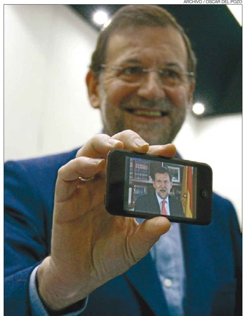
MARIANO RAJOY ▶ El aspirante de los populares «vive con pasión las nuevas tecnologías». Arriba, en un acto celebrado en Ifema en el 2008.