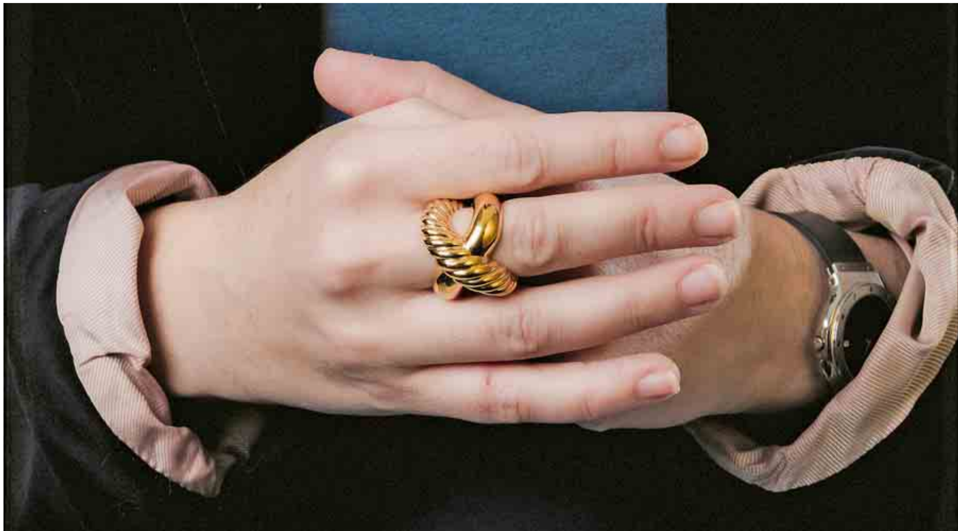
LAS MANOS Toda la actividad del nuevo gobierno pasará por las manos de Soraya, que sostiene tres carteras: vicepresidenta única, ministra de Presidencia y portavoz.

GRACIANO PALOMO T reinta y uno de marzo de 2008. 10:30 de la mañana. Planta séptima de Génova 13, cuartel general del PP. Despacho del presidente nacional. —¿Qué tal Soraya, eeeeh?— inicia la conversación Mariano Rajoy al mismo tiempo que da profundas caladas a un puro habano de grandes dimensiones marca Cohiba—. Esto está duro, ¿eeeh? Pero vamos a dar la cara... Creo que te voy hacer una putada... ¿eeeh?