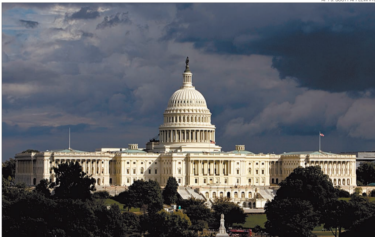
► El Capitolio, en Washington, símbolo de la democracia estadounidense.

George Washington, John Adams y Thomas Jefferson fueron los fundadores de la república norteamericana y, por este orden, los primeros presidentes. A ellos dedica Gore Vidal su ensayo La invención de una nación (Anagrama), en el que explica cómo elaboraron una Constitución que debía crear una democracia auténtica. Vidal, perteneciente a una familia de larga tra-