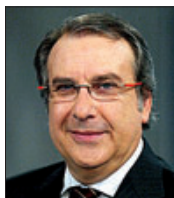
JOSEP CUNÍ PERIODISTA

«Montilla va fer de Montilla. Sense ser un comunicador ni estar dotat per a la seducció televisiva, ho va contestar tot, quasi no es va immutar, i es va desmarcar quan li va convenir. Un os dur de rosegat»