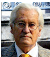
ORIOL BOHIGAS ARQUITECTE

«L'he vist critic i valent. Crític amb Zapatero, crític amb Maragall i fins i tot crític amb ell mateix («Senyora, jo tampoc parlo gaire bé el català»), encara que ha millorat. Com jo»