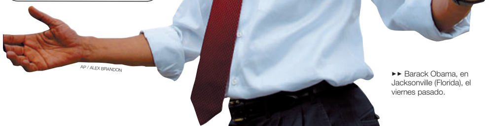
►► Barack Obama, en Jacksonville (Florida), el viernes pasado.