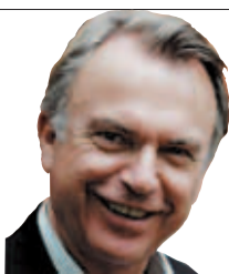
Sam Neill Actor 61