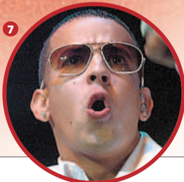
1. James Caan 2. Lorenzo Lamas 3. Lou Ferrigno 4. Patricia Heaton 5. John Voight 6. Robert Duvall 7. Daddy Yankee