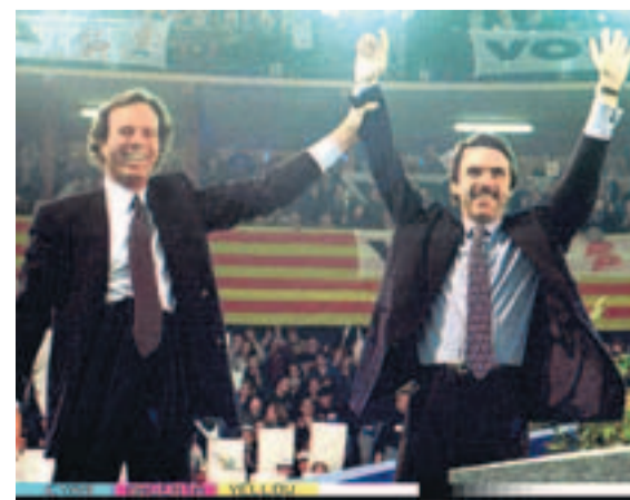
APOYOS. Zapatero y Víctor Manuel (2008) y, a la derecha, Julio Iglesias y Aznar (1996).