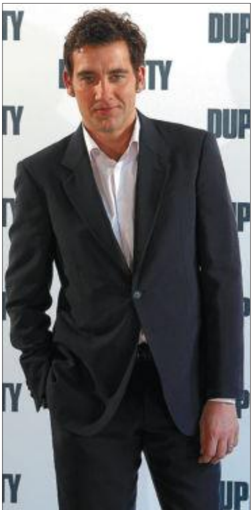
Clive Owen, ayer en Madrid.

Mientras explica aspectos relativos a su trabajo y a la película que está promocionando en Europa, no para de tocarse la cabeza, sus manos no paran quietas. “Me importa mucho el proyecto y el guión a la hora de par-