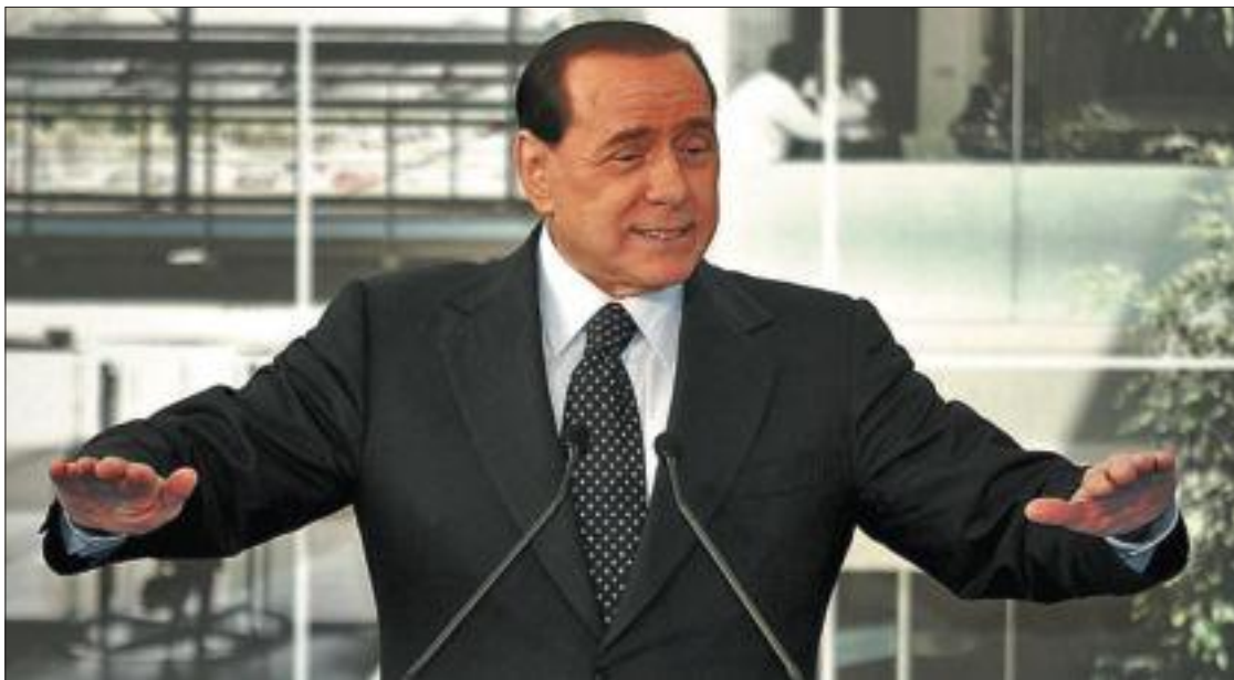
Silvio Berlusconi, durante su intervención en el teatro de Roma.

Pero Berlusconi dio lo mejor de sí cuando escenificó con gestos