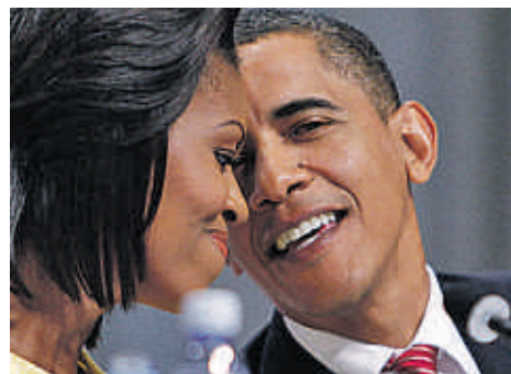
El presidente Obama, con su mujer

puestas noticias de que Michelle Obama había usado un término despectivo para referirse a los blancos, o los rumores de que Barack Obama se había educado de niño en una escuela islámica. Un rumor constante durante la campaña fue también que Oba-