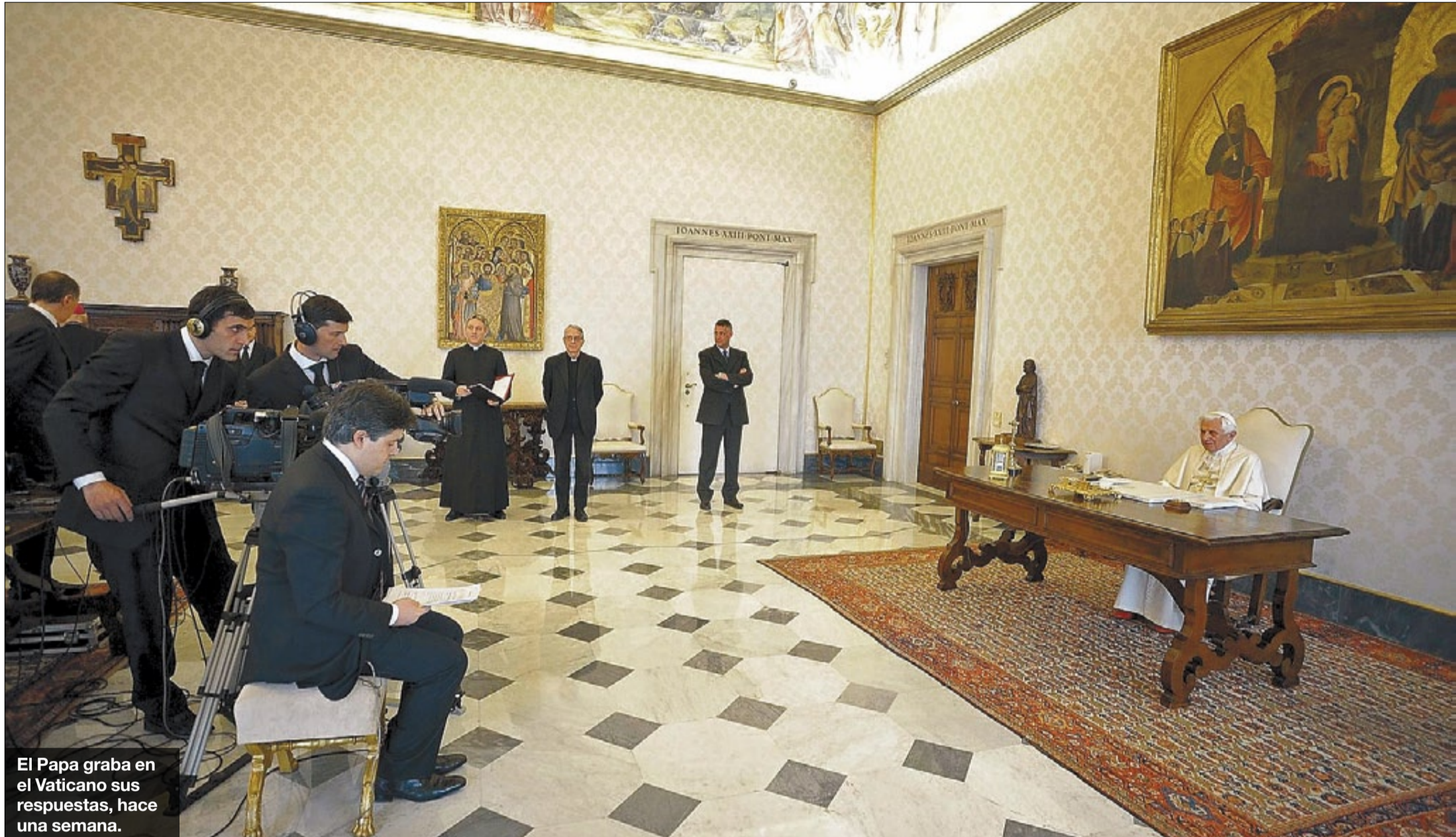
El Papa graba en el Vaticano sus respuestas, hace una semana.