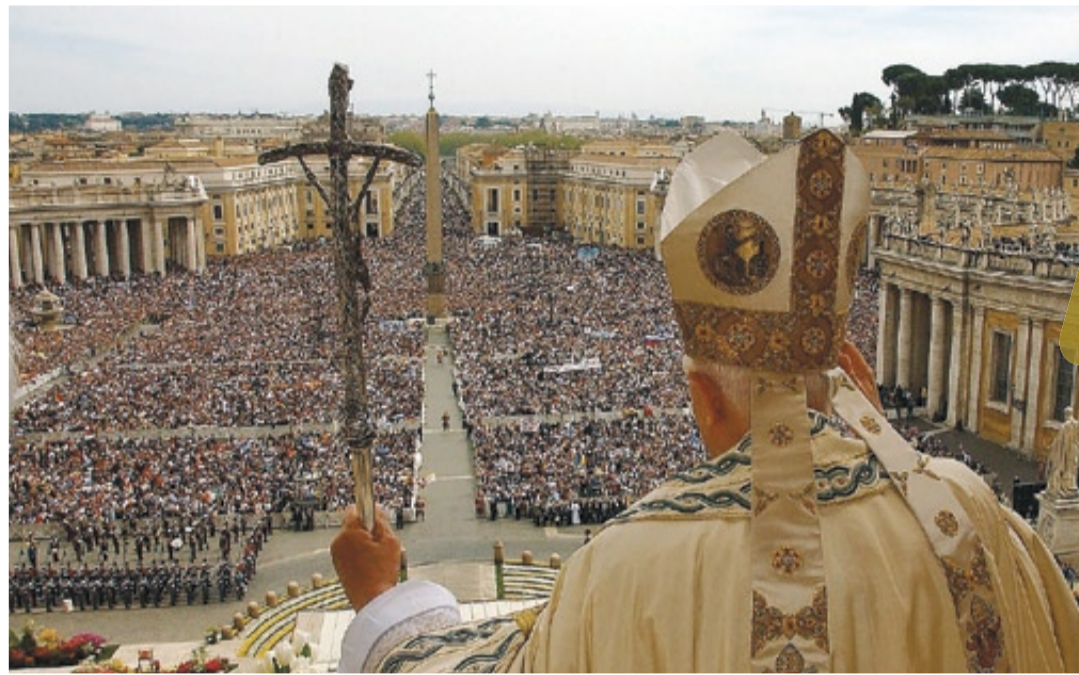
El Papa Benedicto XVI desde la Basílica de San Pedro del Vaticano en el 2006