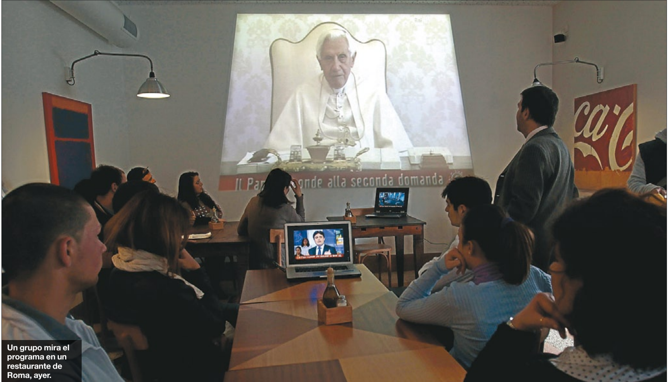
Un grupo mira el programa en un restaurante de Roma, ayer.

sotros de que existe una vida nueva, hacia la que estamos en camino».