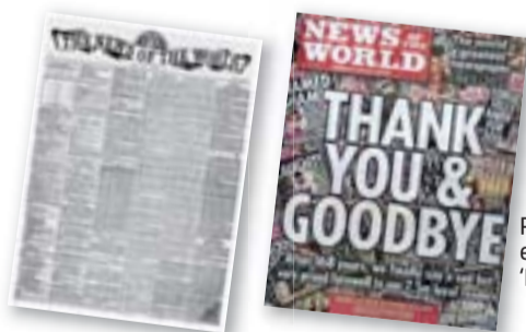
Primer i últim exemplar del 'News of the World'