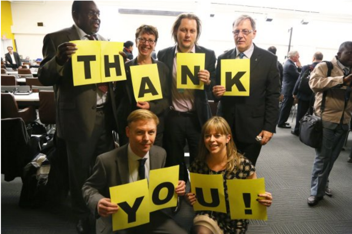
Delegados/as de Amnistía Internacional en la Conferencia de la ONU sobre el Tratado de Comercio de Armas.