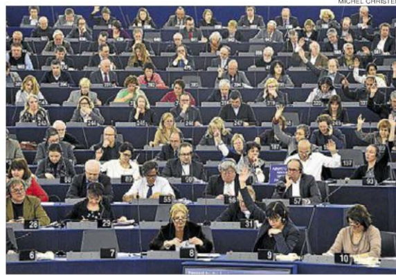
► Sesión del Parlamento Europeo, el pasado enero, en Estrasburgo.

La buena noticia es que la desafección no es por la democracia en sí, sino por las instituciones y por los políticos que forman parte de ellas. Hay un alto grado de apoyo democrático y no se duda de su legitimidad, pero sí de la práctica política en sí. Las razones son diversas, pero la crisis y el modo como ésta ha afectado a los ciudadanos es una fuente segura de desafección, que ya no con-